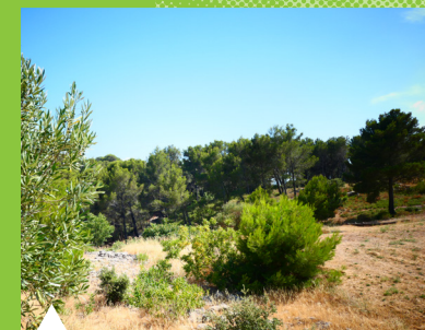
Espaces verts volontairement non entretenus