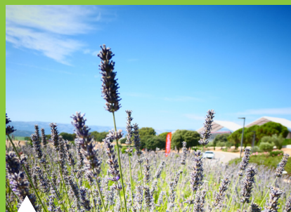
Plantation d'espèces locales, peu consommatrices en eau, mellifères...